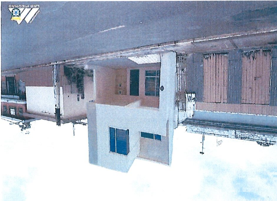
Modelo de Vivienda propuesto